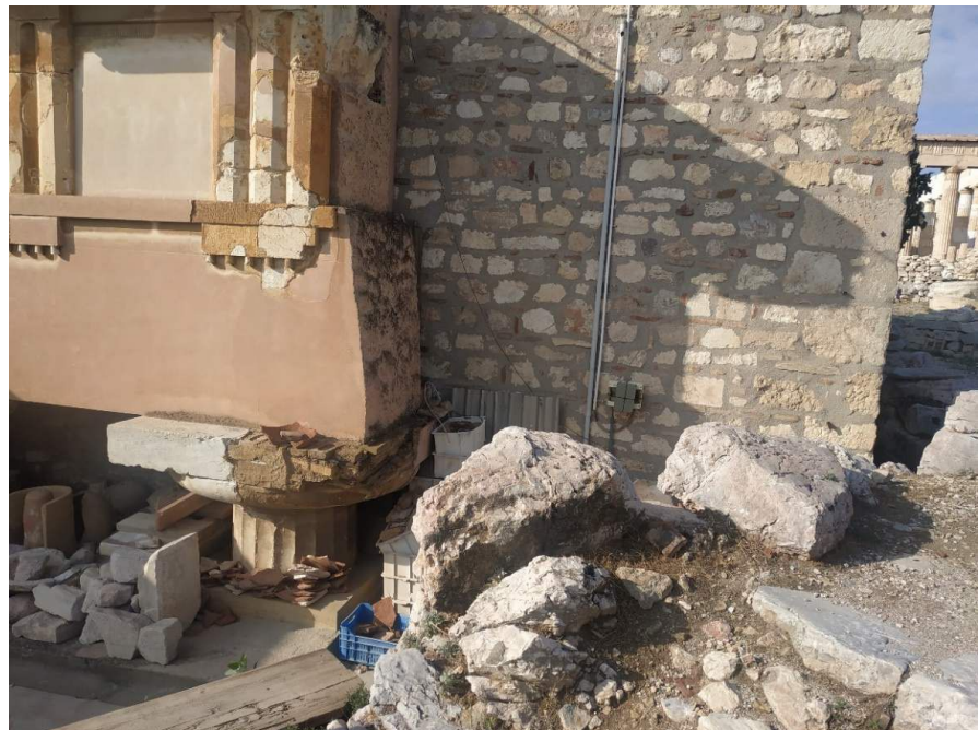
Φωτογραφία 2. Βάθρο στήριξης «Θριγκού»