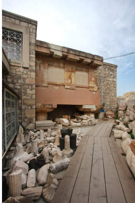
Φωτογραφία 1. Όψη «Θριγκού Μηλιάδη»