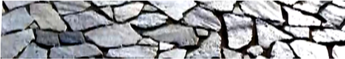
Εικ.1, σχήμα και τοποθέτηση