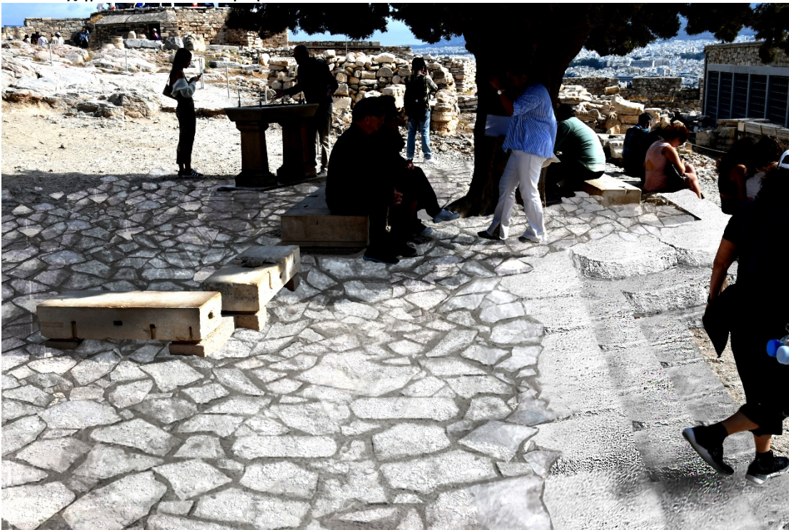
Εικ.2, Γενική εικόνα