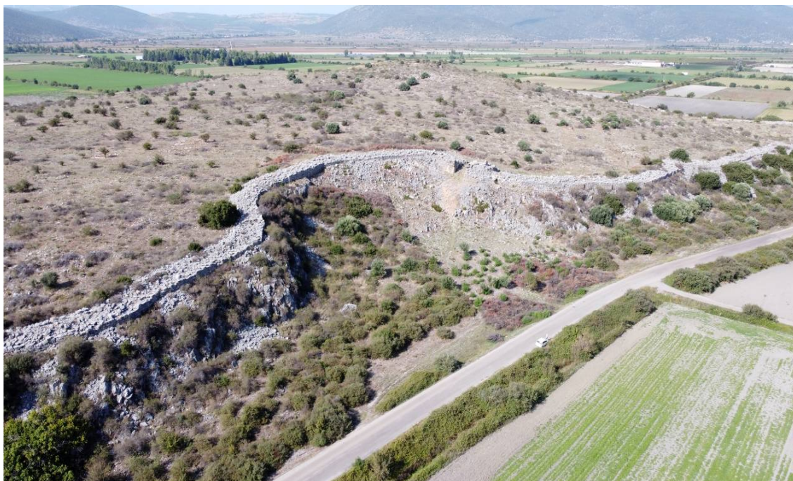
Εικόνα 1. Η νότια πύλη του Γλα και τμήμα της νότιας οχύρωσης